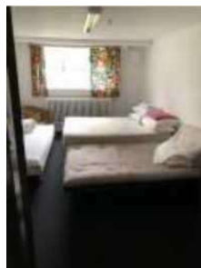
Gæsteværelset set fra gangen 1

Der er en dobbeltseng, en enkeltmandsseng og en sovesofa med soveplads til ca. 5 personer. Der er som udgangspunkt hverken dyner, puder, sengetøj eller soveposer i gæsteværelset, så det skal man selv medbringe.